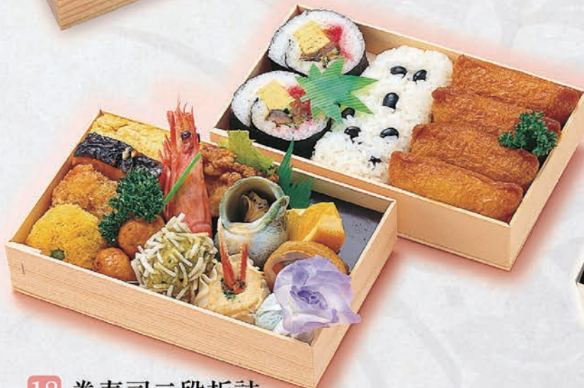
18 巻寿司二段折詰 2,500円(税別)