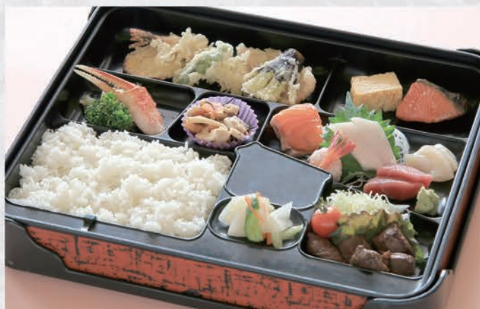
7 お弁当 2,040円(税別)