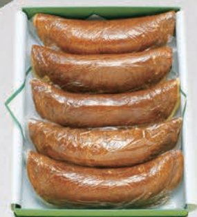
25 中華まんじゅう 小 1,800円(税別) (5本入) 中 2,000円(税別) 大 2,500円(税別)