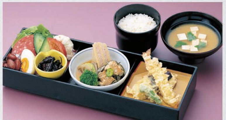
23 お弁当 800円(税別)