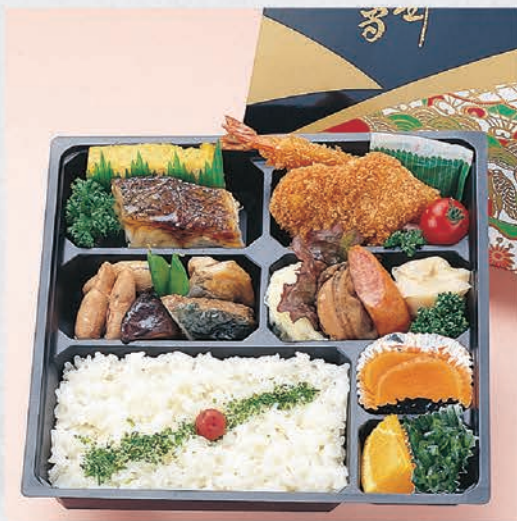
20 お弁当 1,000円(税別)