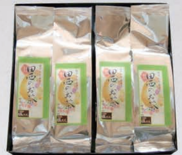
27 田西のお茶(抹茶入り玄米茶) 1,000円・2,000円(税別) ※写真は2,000円です。