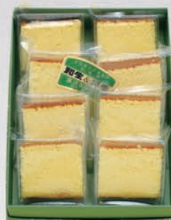
26 カステラ 1,000円(税別)～