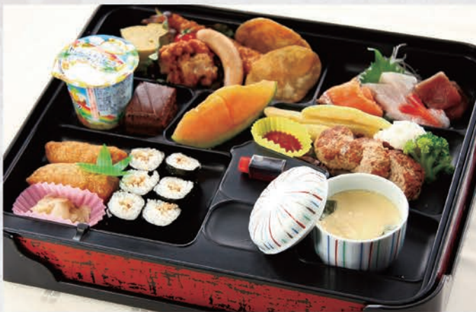
9 お子様弁当 2,000円(税別) 小学生向き