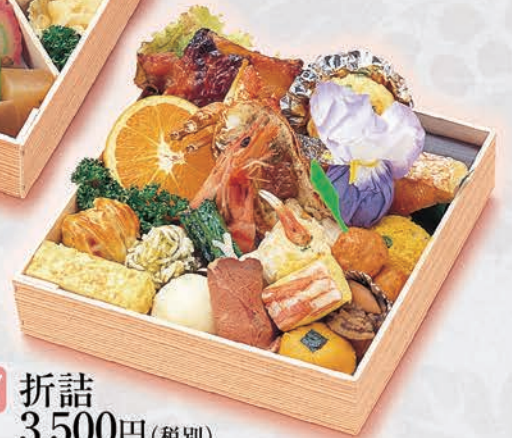
17 折詰 3,500円(税別)