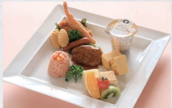
10 お子様プレート 1,000円(税別) 幼児向き