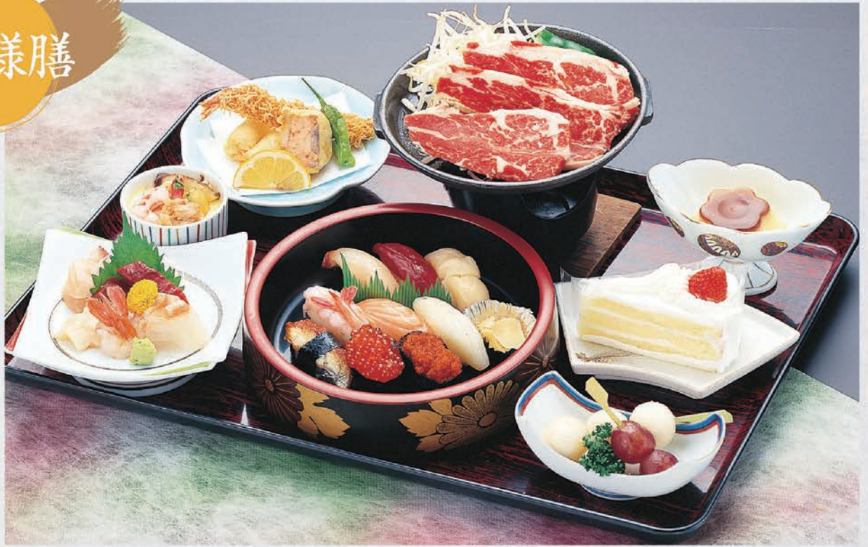
8 お子様膳 5,000円(税別) 小学生高学年～高校生向き