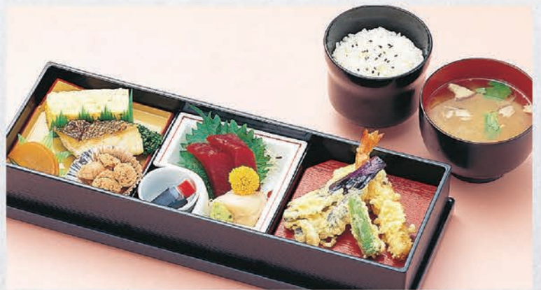
22 お弁当 1,000円(税別)