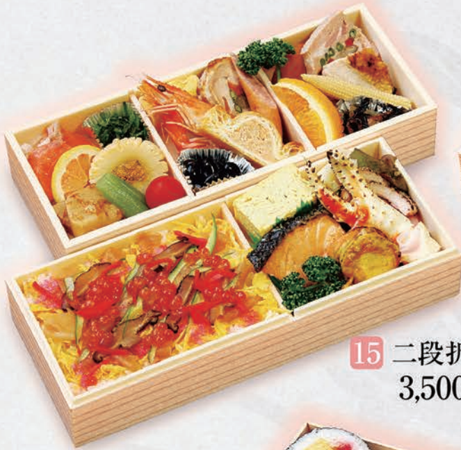
15 二段折詰 3,500円(税別)