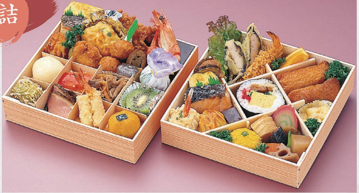
14 二段折詰 5,000円(税別)