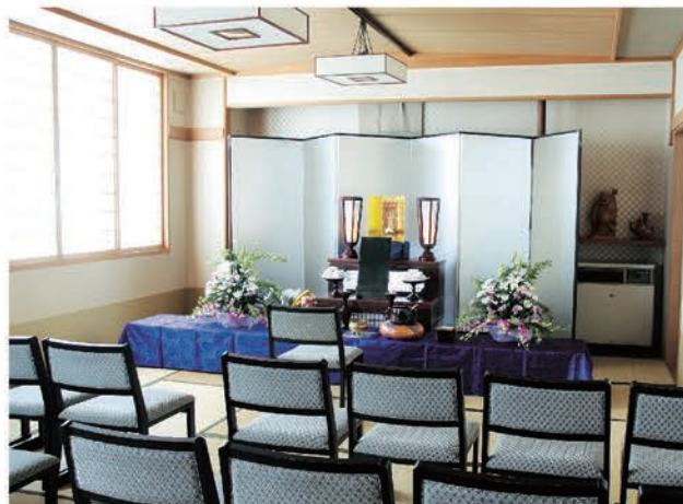
別館2階 和室(法要祭壇)