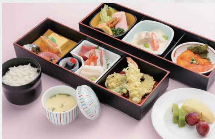
6 お弁当 3,500円(税別)