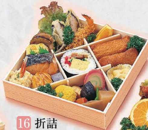
16 折詰 3,000円(税別)