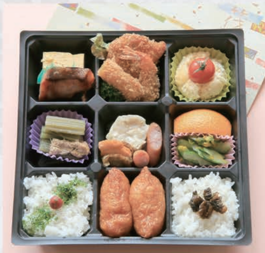
21 お弁当 1,000円(税別)