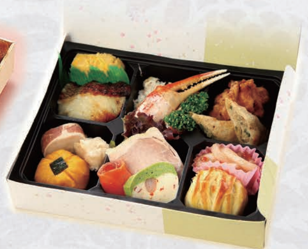
19 お持ち帰りパック 1,500円(税別)