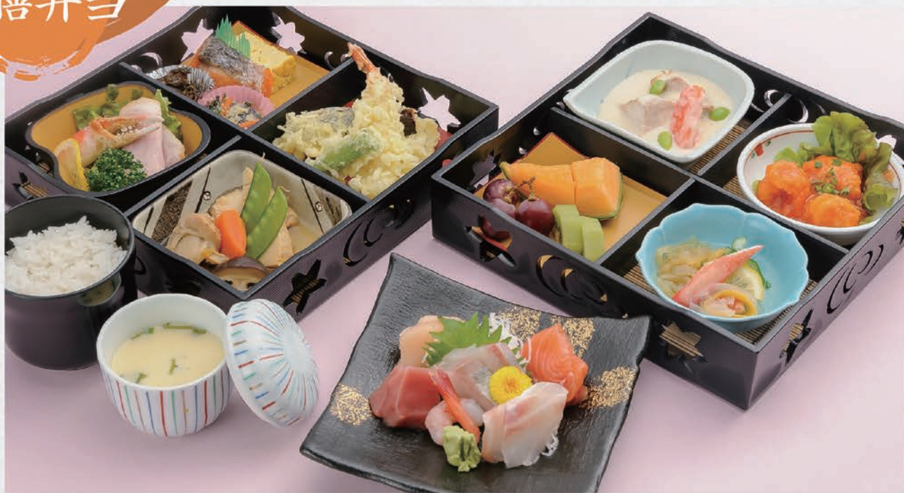
5 お弁当 5,000円(税別)

ご予算に応じてお料理内容を調製いたします。(2,000円~5,000円(税別))