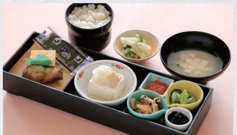
24 お弁当 800円(税別)