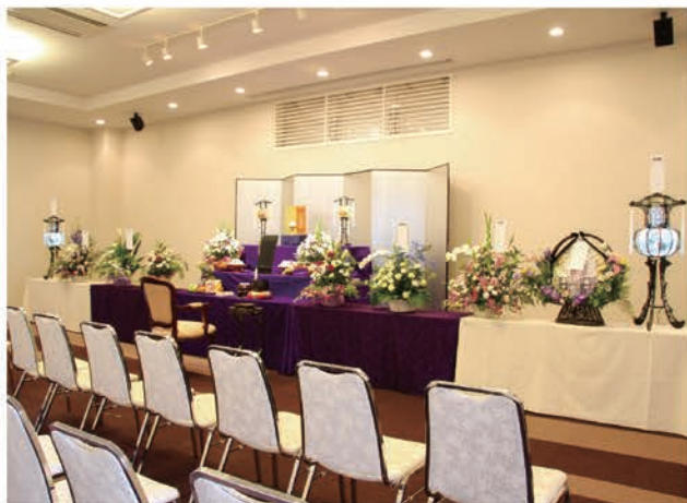
本館ホール(法要祭壇)